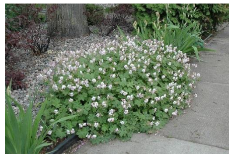
Obr. (zleva: Rudbeckia fulgida 'Goldsturm', Penstemon strictus 'Rocky Mountain Blue', Geranium x cantabrigiense 'Biokovo')