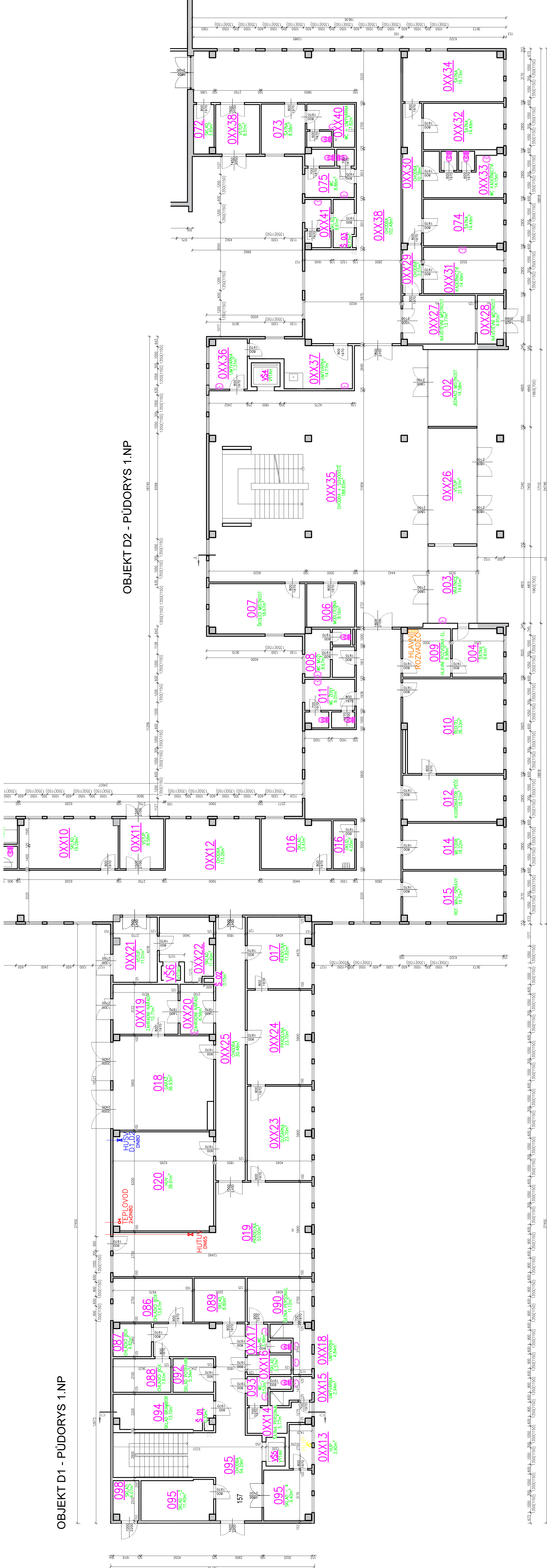
OBJEKT D2 - PŮDORYS 1.NP