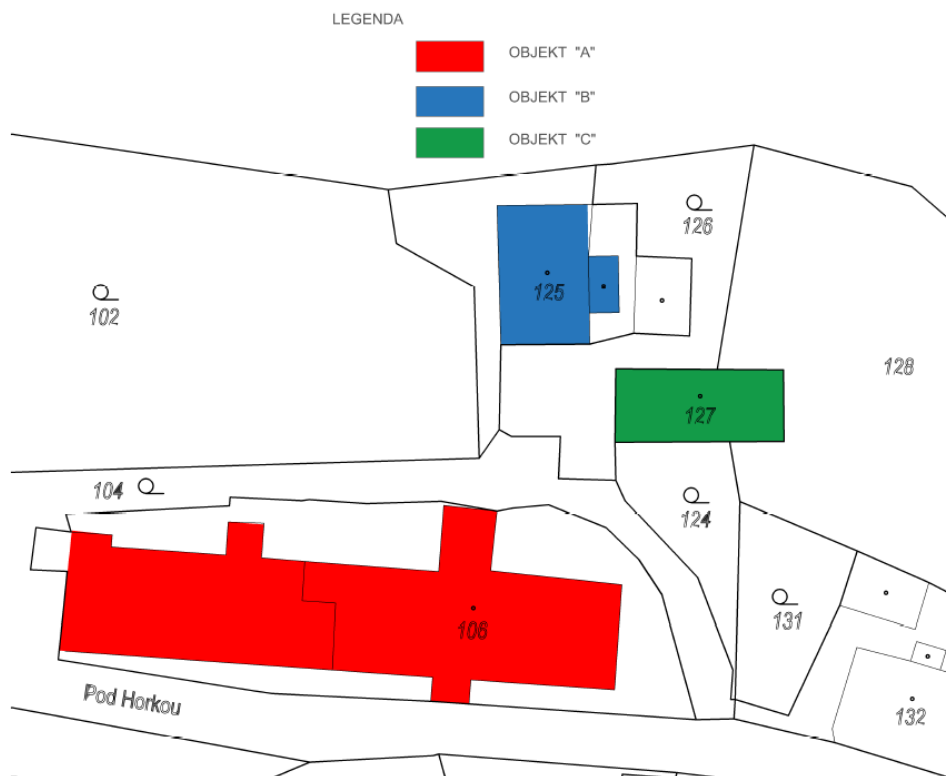
Obrázek č. 1. – schématické znázornění objektů

Domov pro seniory Chlumec se skládá z hlavní budovy – objektu „A“ a dvou provozních objektů (objekt „B“ – technické zázemí, objekt „C“ – prádelna).