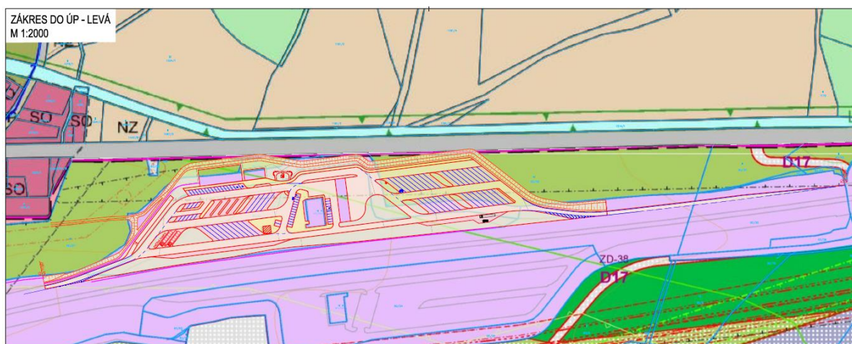
Zákres záměru do Územního plánu Ústí nad Labem – Levá strana D8

Změna se týká funkčního využití pozemků v katastrálním území Dělouš. Dotčené pozemky vyplývají z dokumentace záměru společnosti ŘSD – viz výkres B.7.1_Přehled dotčených pozemků_Levá a výkres B.7.1_Přehled dotčených pozemků_Pravá.