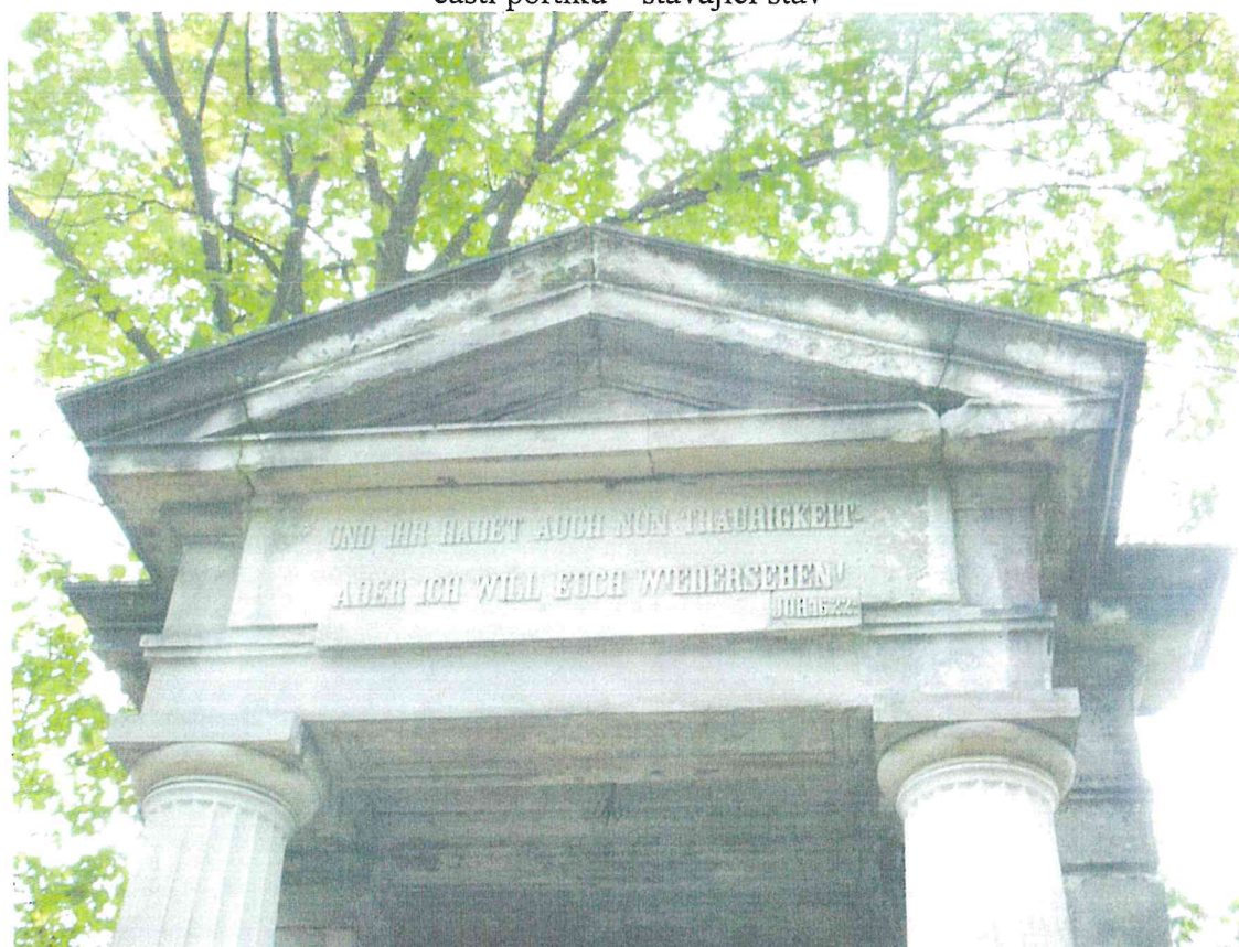
Ústí nad Labem, Střekov, hřbitov, hrobka rodiny Alexandra Edlera von Wölfel, detail horní části portiku – stávající stav