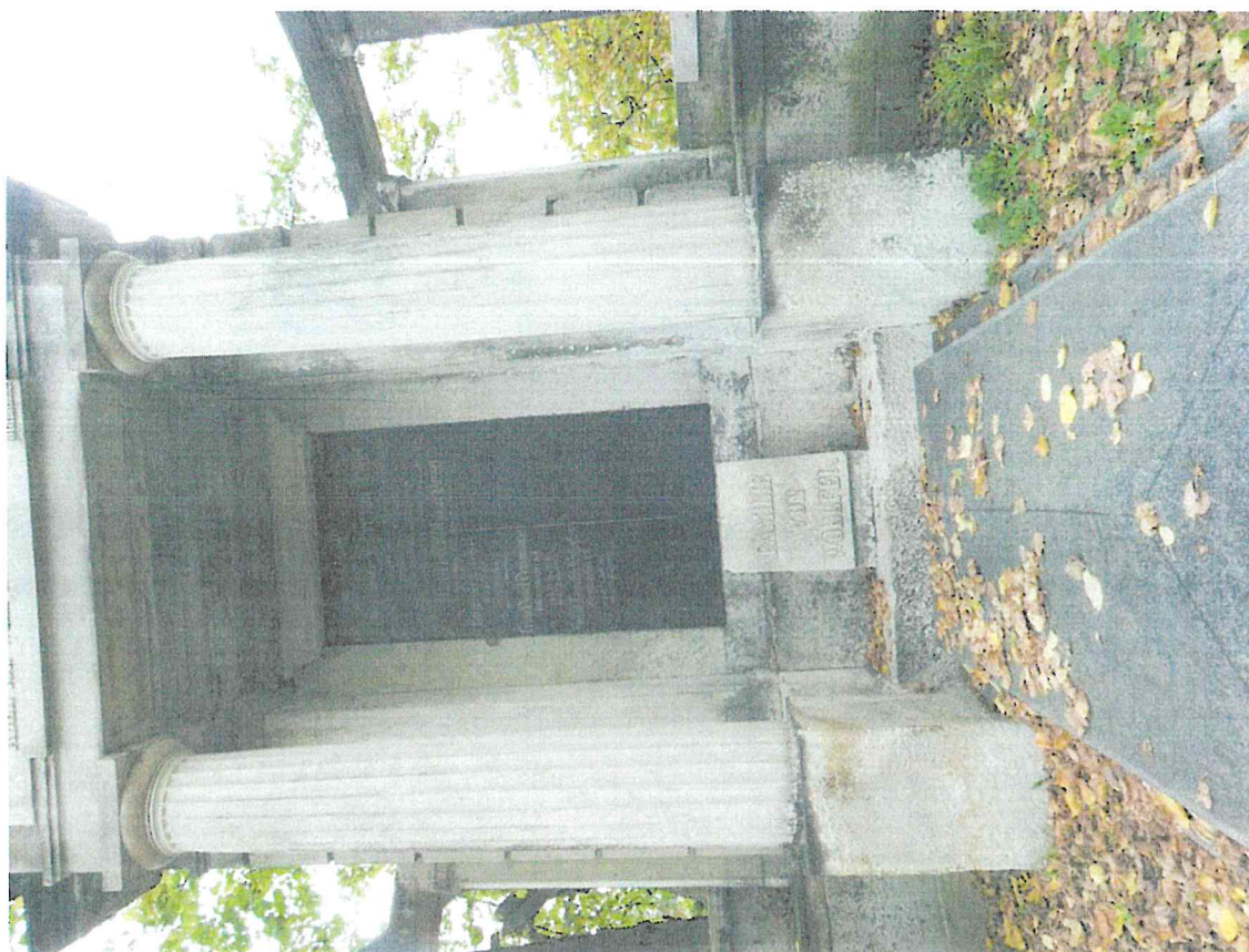
Ústí nad Labem, Střekov, hřbitov, hrobka rodiny Alexandra Edlera von Wölfel, detail střední části portiku – stávající stav