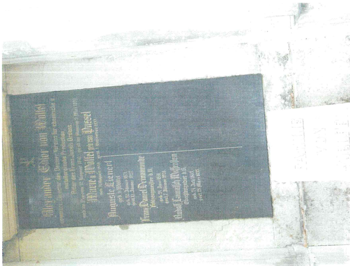
Ústí nad Labem, Střekov, hřbitov, hrobka rodiny Alexandra Edlera von Wölfel, detail nápisové desky na zadní stěně portiku – stávající stav