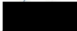
Vladimír Lazar jednatel

HELGOS, s.r.o. SERVIS, REVIZEK STANOVÝTAHŮ Revoluční 8, 400 02 Labem Tel.: 475 200 842 90120091:2009 OHAS 18001:200805020091:2005 IC: 48711732 J0710723711732